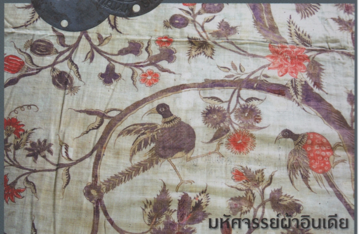
บทคารวะผ้าอินเดีย