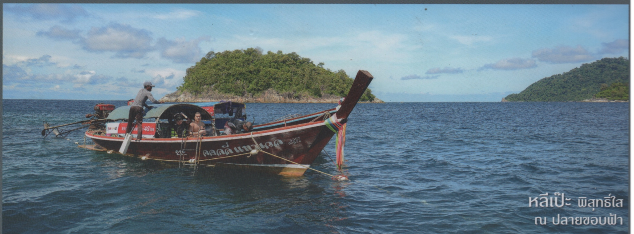
หลีเป๊ะ พืชไร่ น ปลายขอบฟ้า