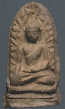
พระรอดพิมพ์เล็ก

นิตยสารเพื่อความรื่นรมย์ ชั้นชมอดีต รักษาปัจจุบัน สรรค์สร้างอนาคต anurakmag.com