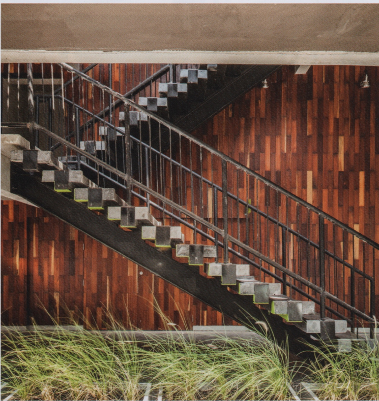
ผนังไม้จากวัสดุเก่าที่เคยติดตั้งอยู่กับอาคาร สถาปนิกออกแบบให้นำมาปรับใช้โดยจัดวางใหม่ เช่นเดียวกับราวบันไดและแผ่นตะแกรงเหล็กที่สร้างจุดเด่นอย่างลงตัว

“ในเชิงวิศวกรรม แน่แน่นอนว่าตึกใหม่ย่อมมีนวัตกรรมที่ดีกว่า บางทีการสร้างใหม่จะง่ายกว่ามาก เพราะการก่อสร้างทำตามแบบไล่จากฐานขึ้นมาชั้นบน แต่ถ้ารีโนเวตอาจติดขัดหลายอย่างด้วยสภาพที่เสื่อมไป อย่างเช่นปูนก็มีสภาพตามอายุของมัน หรือมีฐานรากที่ถูกออกแบบมาให้รับน้ำหนักได้แค่นี้ ไม่สามารถต่อเติมอะไรได้อีก ถ้าเปลี่ยนก็ต้องมีเทคโนโลยีเข้ามารองรับซึ่งอาจจะมีค่าใช้จ่ายมากกว่า แต่หลายคนก็เลือกที่จะรีโนเวต ซึ่งถ้ามองเห็นความเป็นไปได้ เราจะพยายามทำให้ได้ แต่ส่วนไหนที่ไม่สามารถใช้งานได้แล้วจริงๆ ก็ต้องยอมปล่อยให้และหาจุดที่ลงตัวที่สุด” เฟรนด์เล่าในมุมวิศวกร เธอไม่ปฏิเสธความยาก แต่สามารถเปิดใจรับมุมมองความงามของสถาปนิกได้โดยง่าย