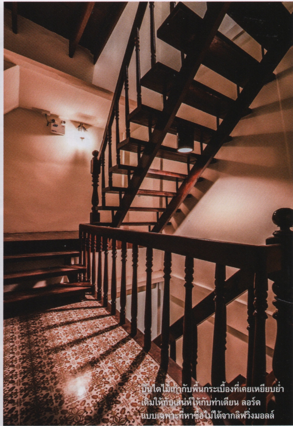
บันไดไม้สักกับพื้นกระเบื้องที่เคยเหยียบย่ำ เดิมใต้กับเสนที่ให้กับทำเตียง สอร์ด แบบเฉพาะที่หาซื้อไม่ได้จากลิฟวิ่งมอลล์