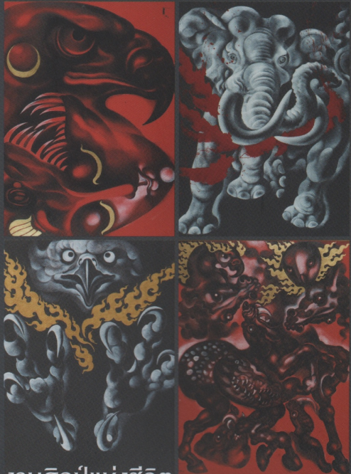
งานศิลปะแห่งชีวิต ของคุณสมบัติ วัฒนไทย