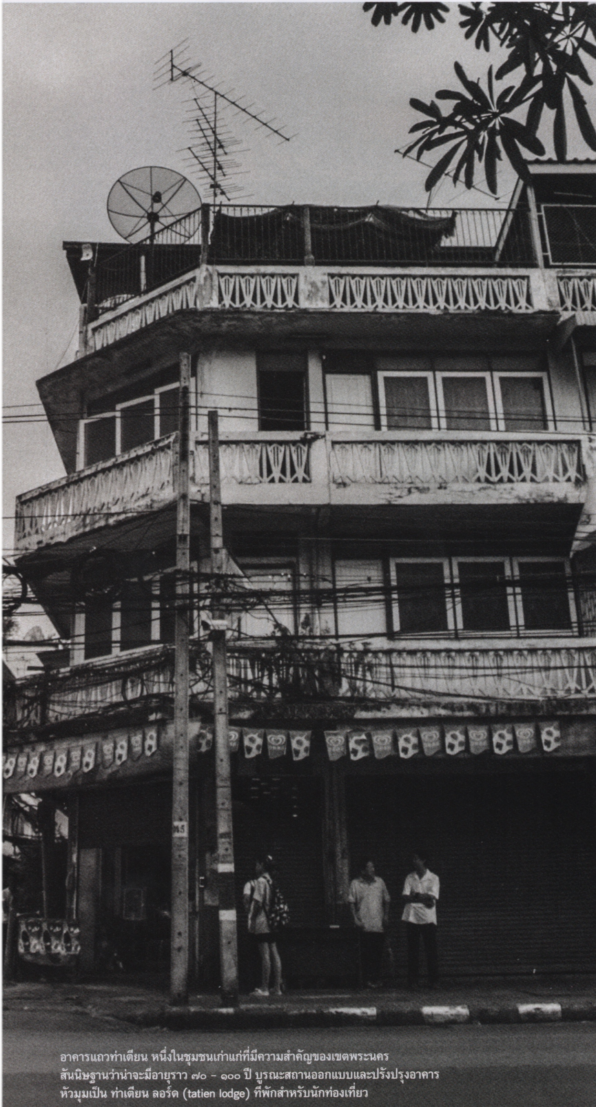
อาคารแถวท่าเตียน หนึ่งในชุมชนเก่าแก่ที่มีความสำคัญของเขตพระนคร สันนิษฐานว่าน่าจะมียุขราว ๗๐ - ๑๐๐ ปี บูรณะสถานออกแบบและปรับปรุงอาคาร หัวมุมเป็น ท่าเตียน ลอร์ด (tation lodge) ที่พักสำหรับนักท่องเที่ยว

แพร่เล่าถึงการทำงานครั้งหนึ่งที่เธอ ประทับใจ ลงเอยด้วยงานปรับปรุงบ้านไม้เก่า อายุกว่า ๕๐ ปี จากสภาพเดิมที่ทรุดโทรม กลายเป็นที่พักยอดนิยมของนักเดินทาง ด้วย บรรยากาศของระเบียงหน้าบ้านและสนาม หน้าบ้านขนาดใหญ่ มีพื้นที่โปร่งโล่งพร้อมจัด วางมุมผ่อนคลาย ให้อารมณ์เหมือนบ้านที่ สมาชิกสามารถใช้ส่วนต่างๆ ของบ้านแชร์ ประสบการณ์ร่วมกัน