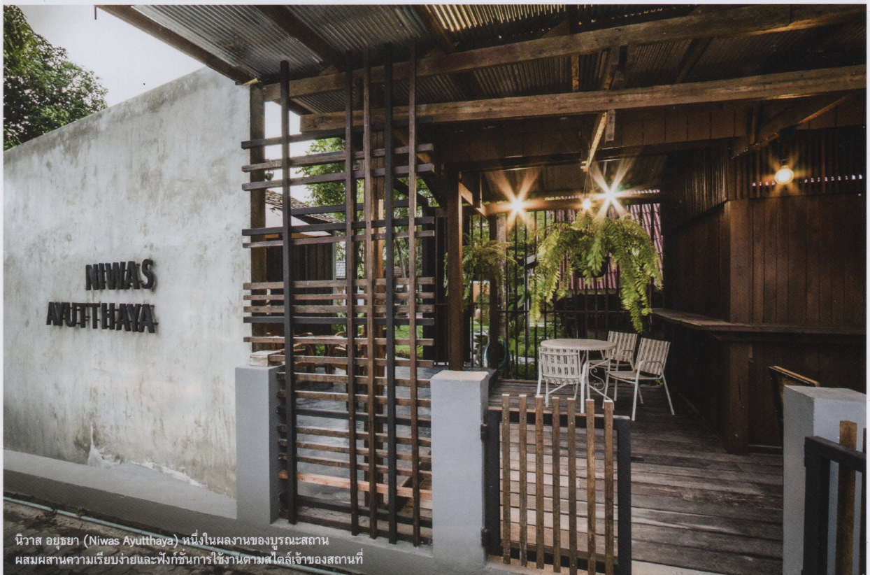
นิवास อยุธยา (Niwas Ayutthaya) หนึ่งในผลงานของบูรณะสถาน ผสมผสานความเรียบง่ายและฟังก์ชันการใช้งานตามสไตล์เจ้าของสถานที่