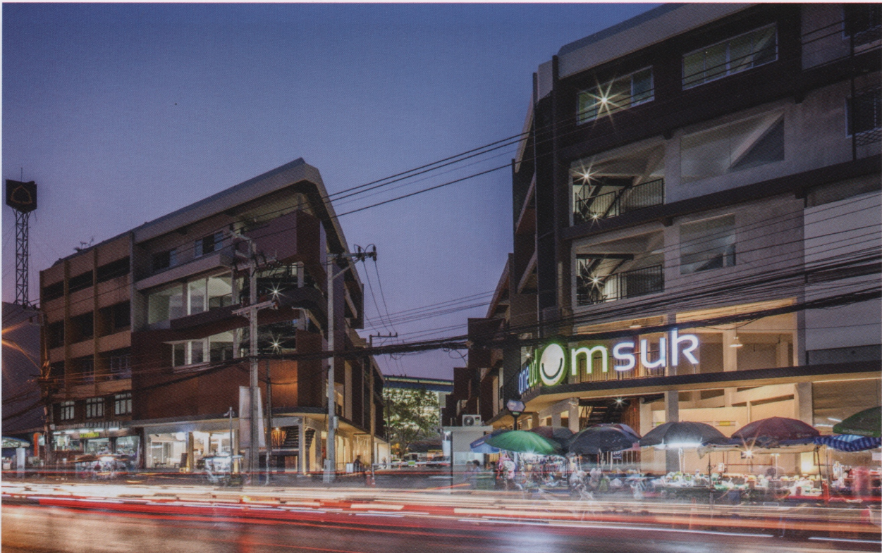
35 ปี ผ่านไป สถานที่ที่ราวกับหนุ่มสาววัยกลางคน เต็มไปด้วยชีวิตชีวาไม่เปลี่ยวเหงาเหมือนเคย