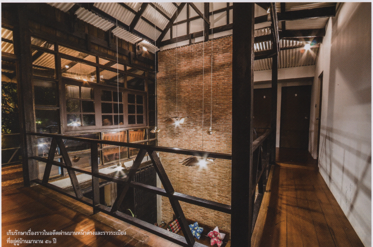
เก็บรักษาเรื่องราวในอดีตผ่านบานหน้าต่างและราวระเบียง ที่อยู่คู่บ้านมานาน ๕๐ ปี