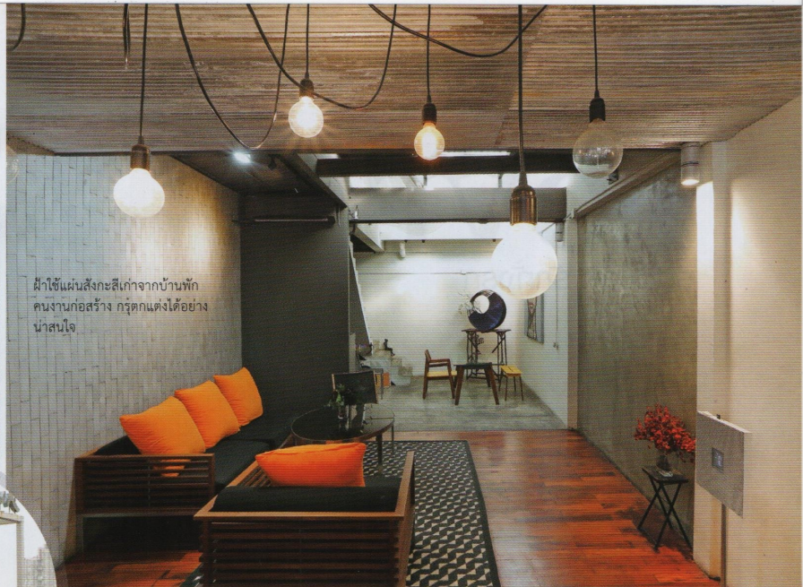
ผ้าใช้ผ่านสิ่งกะลือจากบ้านพัก คนงานก่อสร้าง กรุดกแต่งได้อย่าง น่าสนใจ

“ไปใช้เพียงแค่บูรณะตึกเก่าให้กลับมาใช้ประโยชน์และสวยงามได้เท่านั้น แต่สำหรับโครงการ One Udomsuk ยังมีอีกหนึ่งจุดที่สำคัญที่สถาปนิกของ “บูรณะสถาน” อย่ปากบอกว่า มันเป็นงานริเวกที่ท้าทายมาก ซึ่งผมต้องยอมรับว่านี่คือเรื่องสนุกกับโจทย์ที่ต้องแก้ปัญหาที่ละจุด และทุกจุดล้วนแต่มีดีเทลที่ต้องเอาขณะมันให้ได้”