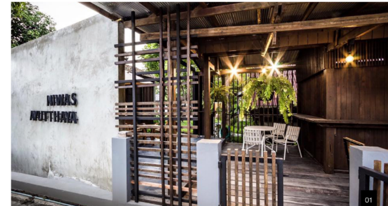
01 | บูรณะ-สถาน 02 | บูรณะ-สถาน 03 | ออฟฟิศบูรณะ-สถาน

อาจกล่าวได้ว่าทั้งพรโพลิน, อังสนา และชิดชนกต่างมีมุมมองต่อการทำงานที่ต่างกัน พวกเขาพบว่าการทำงานที่สร้างครีเอทีฟมีความสุขอยู่ภายในตัวเองกับค่าที่จะห่วยได้เริ่มรู้สึกจิวชีวิตที่เกินปัญหาเพื่อป้องกันไม่ให้เกิดขึ้นซ้ำ ซึ่งมันก็จะกลับไปสู่ตัวตนของบูรณะ-สถานที่ยังยืนหยัดในการทำงานในแวดวงต่อไป เพราะสิ่งนี้เป็นเหมือนความฝัน เป็นเหมือนการค้นพบความสุขของการได้เห็นอาคารเก่ากลับมามีชีวิตชีวอีกครั้ง พวกเขาต่างก็รู้ว่าความรู้สึกแบบนี้มีความหมายแค่ไหน